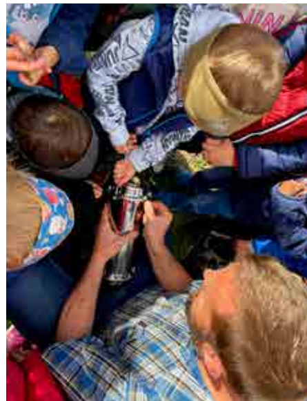
Nun ist alles drin und die Zeitkapsel muss gut verschraubt werden.

DENITH: Ich habe Fotos von der Baustelle gemacht-überall: von Bagger, Haus, Wände, Kran, Lastwagen, vom Bürgermeister, von den Kindern....Fotos