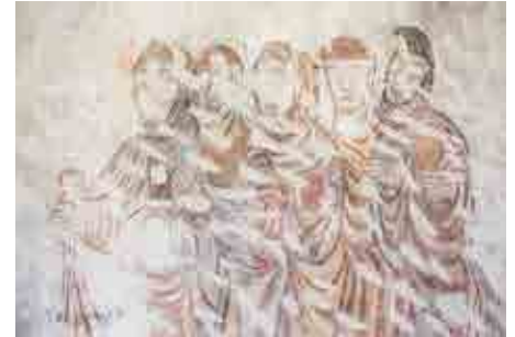
Fresken St. Prokulus