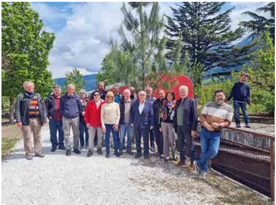
Freiwillige Helfer und Vorstandsmitglieder vor dem Postwagen der Rhätischen Bahn.

Das Vereinslokal „Freunde der Eisenbahn“ befindet sich im Bahnhof