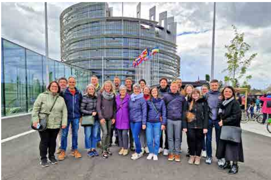
Die 21-köpfige Naturnser Delegation vor dem EU-Parlament in Straßburg.

Vielen ist gar nicht bewusst, auf wie viele Menschen sich das Ergebnis der Wahl zum Europäischen Parlament auswirkt. Das Europäische Parlament verabschiedet Rechtsvorschriften, die alle betreffen: große Länder und kleine Gemeinschaften, mächtige Konzerne und junge Start-up-Unternehmen, die Welt und das kleinste Dorf. Mit den Rechtsvorschriften der Union werden die Dinge angegangen, die den meisten Menschen wichtig sind: Umweltschutz, Sicherheit, Migration, Sozialpolitik, Verbraucherrechte, Wirtschaft, Rechtsstaatlichkeit