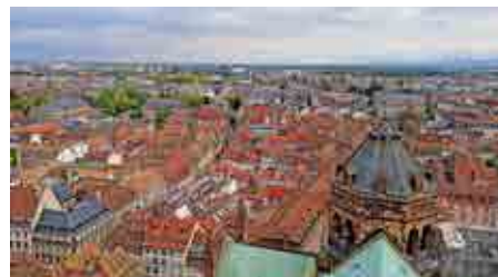
Straßburg: Fachwerkidylle, Gotik, gemütliche Weinstuben und überall Europa.

dungen haben Auswirkungen auf unser Leben. Wer nicht wählen geht, kann auch die Zukunft nicht mitgestalten. Und zudem wird die parlamentarische Demokratie in der Union schwächer, und die Bedeutung ihrer Werte schwindet. Je mehr Menschen wählen gehen, desto stärker wird die Demokratie. (zc) (Quelle: https://elections.europa.eu/de/ )