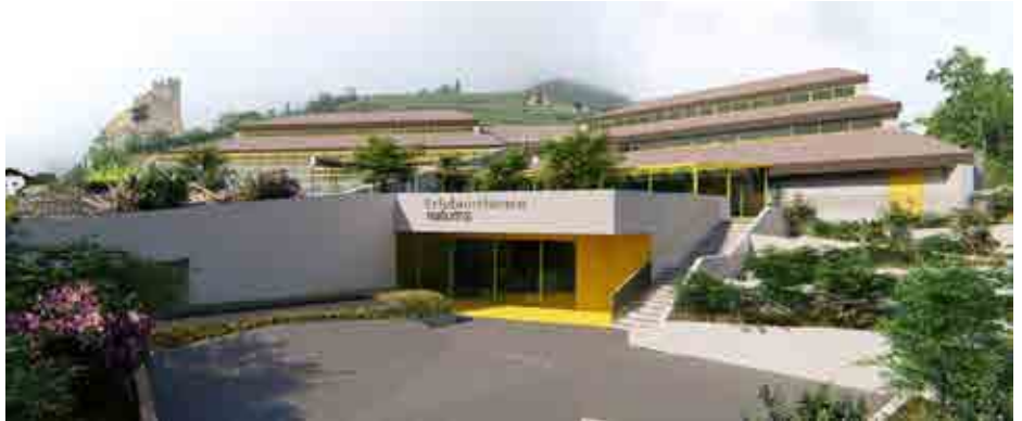
Rendering der Architekten Dejaco & Partner, Brixen.

Über die letzten Herbst- und Wintermonate wurden in Zusammenarbeit mit der Rheuma-Liga Südtirol spezielle Wassergymnastik Kurse für Rheumapatienten in der Erlebnistherme angeboten. Die Bewegung im warmen Thermalwasser lindert nachweislich die Beschwerden. Die beiden Turnusse zu jeweils 10 und 14 Einheiten waren sehr gut besucht, was definitiv für eine weitere Zusammenarbeit mit der Rheuma-Liga Südtirol spricht. (ap, Tanja Gurschler)