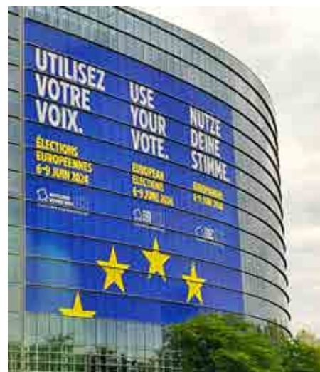
Aufruf an der Fassade des EU-Parlaments: „Nutze deine Stimme!“ bei den EU-Wahlen am 8. und 9. Juni.

Die Demokratie sollte niemals als selbstverständlich angesehen werden. Sie ist eine kollektive Errungenschaft – und wir alle tragen eine kollektive Verantwortung, zu ihrem Erhalt beizutragen. Die Demokratie geht vom Volke aus: Das beginnt damit, bei der Wahl zum Europäischen Parlament seine Stimme abzugeben – und die dort getroffenen Entschei-