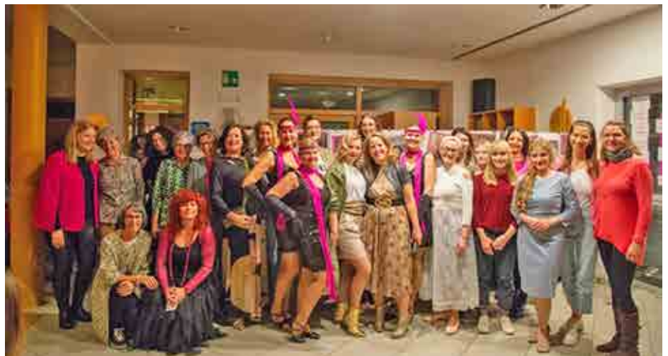
Referentinnen, Tänzerinnen und Bibliotheksteam bei „Von Frau zu Frau“.

aber effektive Pflegetipps und das Thema Permanent Make-up rundeten die charmante Präsentation ab.