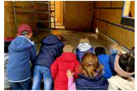
Die neuen Räume müssen genau inspiziert werden.

JULIAN: Bei der Baustelle steht schon das Gerüst und aus Holz sein die Wände und das Dach. Die Arbeiter haben die Balken mit dem Kran auf's Doch glegt. Iatz braucht's noch die Fenster, die Tü-