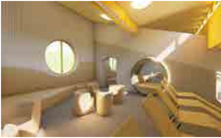
Therme Naturns: Ein neues Kapitel bei der Erlebnistherme wird aufgeschlagen: Grünes Licht für die 2. Bauphase erfolgt.