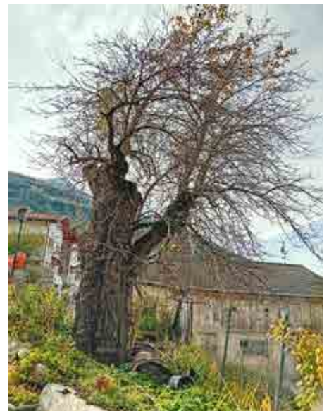
Brand 1899 in Tabland – Palabirnbäum lebt heute noch.

was sie am Feiertag am Leib trugen. Sogar das Geld vieler ist verbrannt. Wie leider fast allerwärts in Tirol sind auch hier die Leute vielfach gar nicht, zum Teil mit geringfügigen Beträgen versichert, man spricht von insgesamt 26.000 Gulden, während natürlich der Schaden ein weit höherer, noch nicht genau zu bestimmen ist. Auf dem Brandplatz war außer der Ortsfeuerwehr im Laufe des Abends erschienen die Feuerwehren von Staben, Naturns, Partschins, Tschars, Kastelbell, Latsch, Goldrain, Tarsch, Morter und Latschinig; doch konnte bei der furchtbaren Gluthitze nicht mehr ausgerichtet werden; auch die Schläuche verbrannten teilweise. Wie enorm die Hitze war, lässt sich daraus entnehmen, dass kein Fensterstock, kein Türstock mehr vorhanden ist, sogar die in das Mauerwerk der Häuser gezogenen Balken sind herausgebrannt. Die Brandstätte bietet einen schauerlichen Anblick. Rauchende Trümmerhaufen, umgeben von nicht mehr benutzbaren ausgebrannten ein- und zweistöckigen Mauern, bilden die traurigen Reste des Dorfes, umgeben von fünf mehr abseits stehenden, vom Feuer verschont gebliebenen Gebäuden. (...)