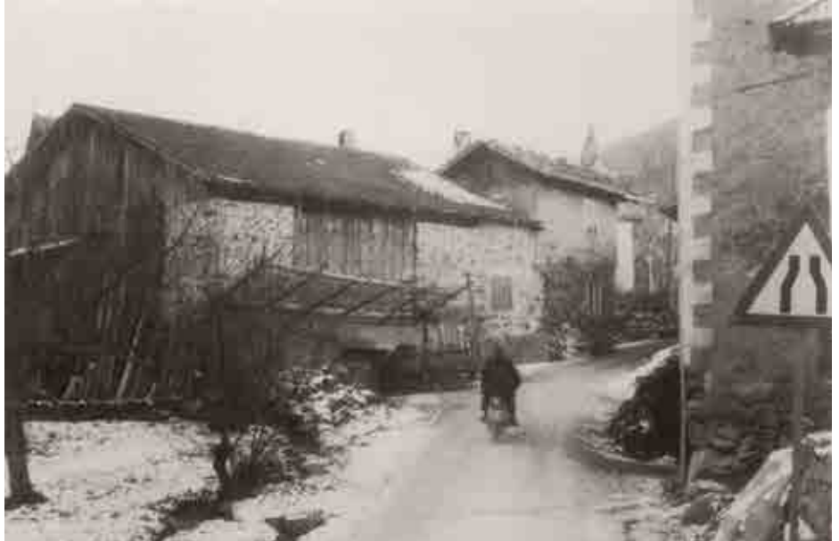
Dorfeinfahrt Ost: Was vom Dorfbrand verschont wurde: Zu Recht als Engstelle ausgewiesen, das Haus Hueber vor dem Abbruch.

Tabland abgebrannt. (...) Binnen einer Stunde war das Vernichtungswerk vollendet, 21 Wohnhäuser, 20 Städel, das Kirchendach, Widum, Gemeindeganzlei, kurz alles war in sich zusammengebrochen und bildete einen einzigen rauchenden Schutthaufen. Bei der außerordentlichen Schnelligkeit des Umsichgreifens und bei dem Mangel fast jeglicher Hilfe war es kaum möglich, das Vieh aus den Ställen zu bringen; nur ganz wenige Habseligkeiten konnten in Sicherheit gebracht werden. Viele, ja die meisten Einwohner haben nichts mehr, als das