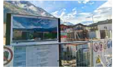
„Leistbares Wohnen“ – ein neues Zuhause für 15 Naturnser Familien entsteht zurzeit in der Wohnbauzone Lahn. Für „Wohnungen mit Preisbindung“ jetzt im Bauamt melden.

Neu“: Ganz im Sinne der „Vision Naturns 2030+“. Jene wenige vom Gemeinderat effektiv neu geschaffenen Baurechte stehen sogar zu 100% den Ansässigen zur Verfügung. Zudem konnten im letzten Jahr sieben Familien ihre neuen Reihenhäuser des geförderten Wohnbaus in Staben beziehen. In Naturns werden derzeit in der Zone Lahn 15 Wohnungen im geförderten Wohnbau neu errichtet. Dank der guten Zusammenarbeit mit der Arche im KVW und einer überlegten Planung liegen die Preise bei diesem Projekt aktuell bei rund 3.000 Euro pro Quadratmeter Konventionalfläche zzgl. 4% Mehrwertsteuer. Auf der öffentlichen Rangordnung für den sozialen Wohnbau befinden sich nur noch vier Antragsteller, diese Liste wird laufend abgearbeitet. Der Gemeindeausschuss kam bei seiner Klausur zum Ergebnis, dass das Thema „Leistbares Wohnen“ sehr vielschichtig ist – und bei weitem auch noch nicht zufriedenstellend gelöst werden konnte. Die Naturnser Gemeinderätinnen und Gemeinderäte aller Parteien nehmen dieses Anliegen aber