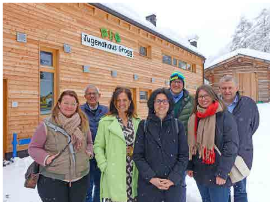
Vorstand AGJD mit Team.

Besonderes Augenmerk lag auf der Stärkung sowohl der ehrenamtlichen als auch der beruflichen Mitarbeitenden der Jugenddienste. Insgesamt sind 20 Jugenddienste mit über 170 Fachkräften, 130 ehrenamtlichen Vorstandsmitgliedern und zahlreichen Freiwilligen über die AGJD zusammengeschlossen. Die Jugenddienste tragen wesentlich zur Entfaltung und Selbstverwirklichung der Jugendlichen sowie zur Gestaltung der Jugendarbeit vor Ort bei. Die AGJD, vor mehr als 25 Jahren von den Jugenddiensten gegründet, dient der Vernetzung und Unterstützung derselben. Die Vielfalt und das Agieren auf Basis der lokalen Bedürfnisse sind