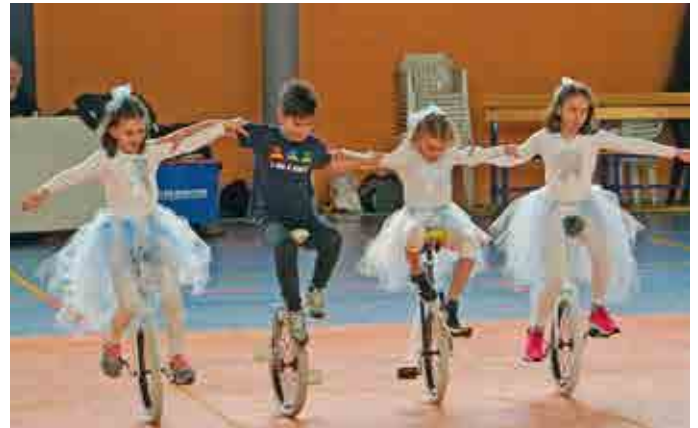
Kleine Gruppenkür der Kleinen.

Die Italienmeisterschaften in den Freestyle-Disziplinen in Telgate bei Bergamo leiteten ein intensives Wettkampffahr für den SSV Naturns – Sektion Einrad ein.