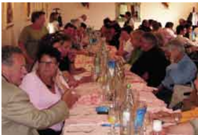
A pranzo a Mozzecane.