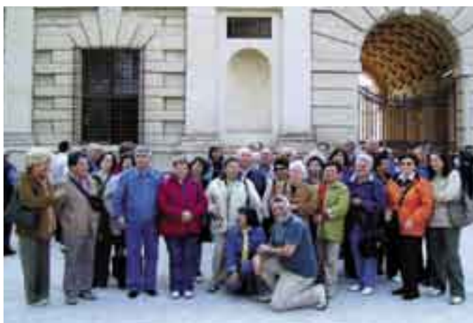
All'entrata del Palazzo Te (capolavoro architettonico di Giulio Romano realizzato nel XVI sec. per ordine di Federico II di Gonzaga).