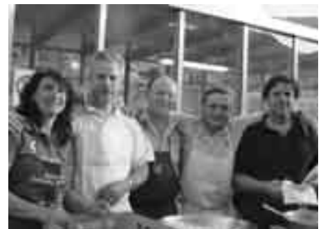
Das Grillteam zauberte bei der Abschlussfeier am 27.05.06 über 300 Portionen.

Zum Abschied in die Sommerpause organisierte die Sektionsleitung am Samstag, den 27. Mai noch ein schönes Fußballfest: am Nachmittag spielte die provinzielle B-Jugend ihr letztes Meisterschaftsspiel und beendete die Saison mit einem Sieg und am Abend trat die Oberligamannschaft 2005/2006 gegen