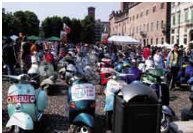
In Piazza delle Erbe c'è la mostra della Vespa.