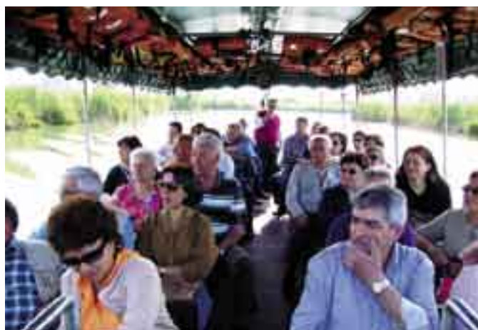
Tutti in barca lungo le valli del Mincio

Mantova si estende nel tratto della pianura Padana che è interessata dalla confluenza del Mincio con il Po..