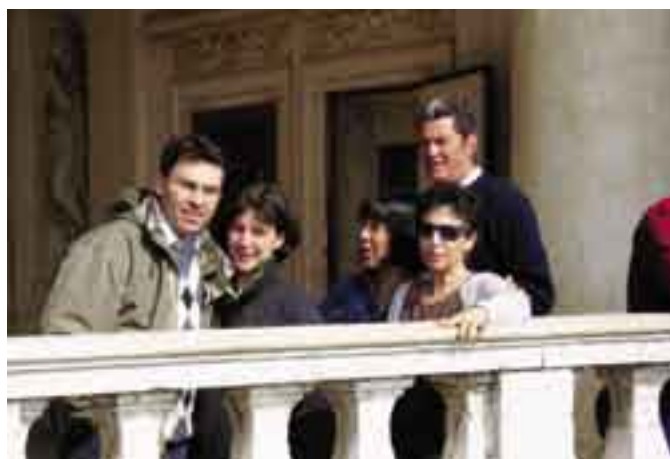
Vista dal Palazzo.