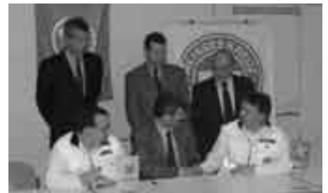
Unterzeichnung Sponsorenvertrag mit Raiffeisenkassen im Sektionsstz.