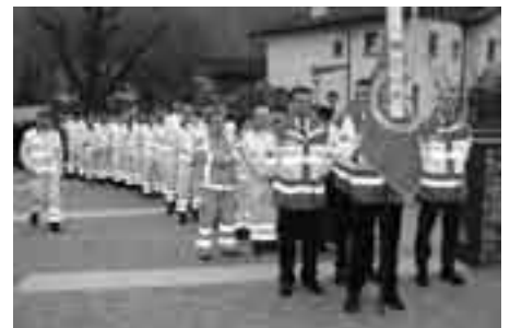
Festlicher Einzug in die Pfarrkirche von Plaus.