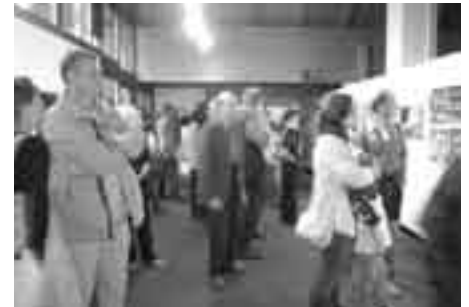
Zahlreiches Publikum bei der Eröffnung.

genannt wurde, hin. Die Botschaft dieser Ausstellung hat Bodini mit seinen faszinierenden Aufnahmen klar formuliert: die Landschaft ist unser Lebensraum und stellt für alle einen unschätzbaren Wert dar, zumal sie eine wichtige Voraussetzung für nachhaltige Lebensqualität ist. Die Landschaft ist aber