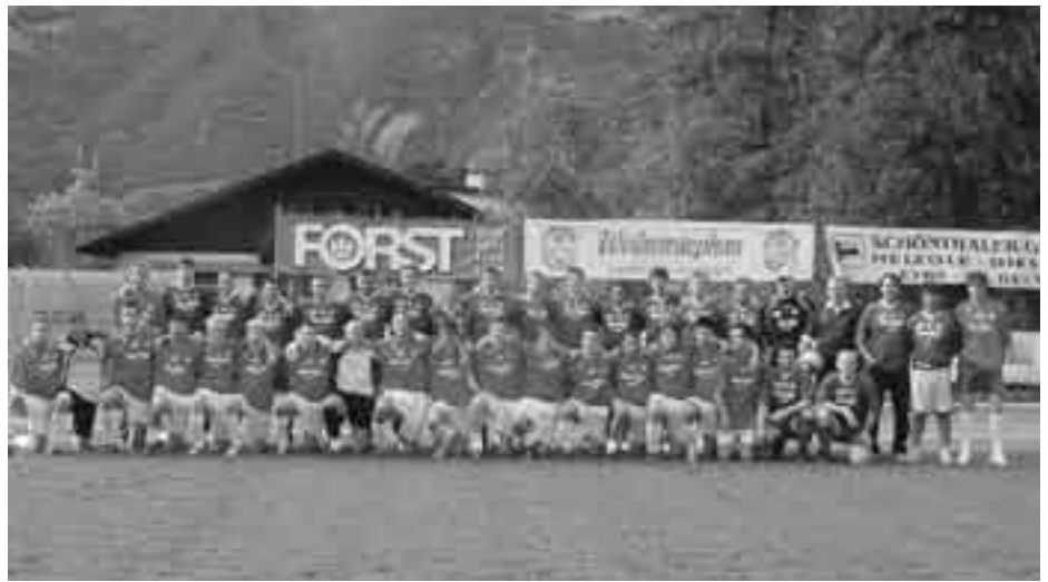
Oberliga 2006 gegen Oberliga 1997.