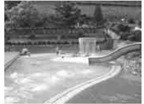
Auch in der Sommersaison 2006 lädt das Erlebnisbad zur erfrischenden Abkühlung.

Durch gezielte Maßnahmen und die Durchführung verschiedener Projekte gelang es den Bilanzverlust der Erlebnisbad GmbH im Vergleich zum Verlust im Vorjahr (123.036 Euro) um über die Hälfte zu reduzieren. Das Erlebnisbad Naturns weiß dementsprechend 2005 einen Verlust von 60.099 Euro auf. Der Umsatz bleibt von