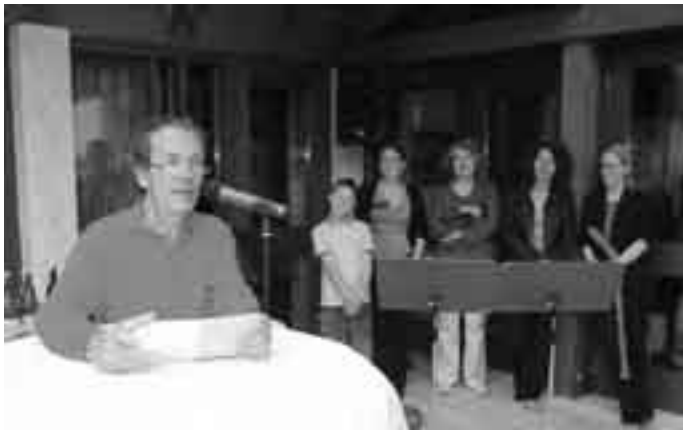
Musikalische Umrahmung durch das Ensemble „flauto dolce“.

sensibel und leicht verwundbar. Deshalb ist Landschaftsschutz mit Lebensschutz gleichzusetzen.