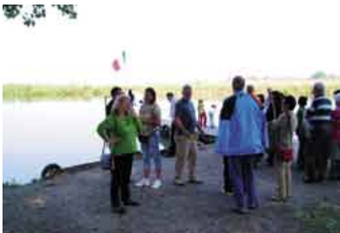
In attesa del battello