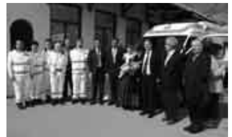
Einweihung des neuen RTW - Ausschuss mit Patin und Bürgermeistern.