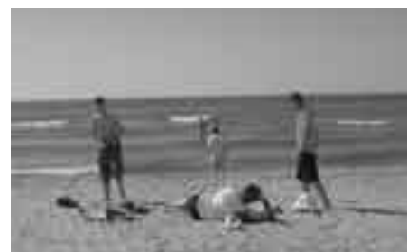
Vor der Abfahrt wurde noch mal Abkühlung im Meer gesucht.

Besonderer Dank gilt allen Gönnern und Sponsoren, die durch ihre Unterstützung die Teilnahme am Endturnier in Taranto erst ermöglicht haben: besonders der Marktgemeinde Naturns, der Fahrschule Rolli, der Bierbrauerei Forst und dem Alber Walter Buchhaltungsservice. (zc)