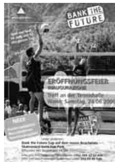
Im Rahmen des Bank the Future Cup wurde der neue Beachplatz eröffnet.

turnser Sportverein, der Erlebnisbad GmbH und dem Pächter des Naturnser Tenniscamp konnte nun auch in Naturns ein neuer Mehrzweckplatz errichtet werden. Im Rahmen des bekannten Bank the Future Cups wurde der Beachplatz gemeinsam mit der Erholungszone Treff an Tenniscamp eröffnet. Ab nun steht die Anlage allen Interessierten zur Verfügung. Der Platz kann auf Vormerkung benützt werden, Reservierungen können direkt im Tenniscamp oder unter Telefon 0473 668094 vorgenommen werden. (zc)