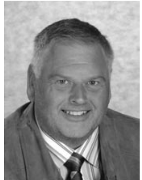
Helmuth Pircher Vizebürgermeister