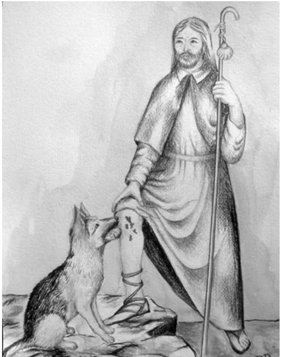
Gezeichnet von der Naturner Künstlerin Elfriede Runggaldier Polverino

Auf dem Rückweg gelangte er in die Stadt Piacenza, wo er selbst an der Pest erkrankte. Sein Leib bedeckte sich mit hässlichen Beulen und die Bewoh-