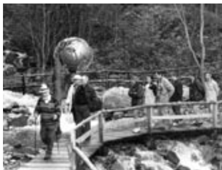
Besichtigungsrundgang unter der Führung von Altdekan Georg Peer