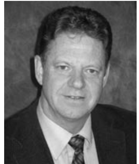
Andreas Heidegger Bürgermeister

Wir wünschen den Jubiläumsfeierlichkeiten einen guten Verlauf und drücken in diesem Sinne der Sektion zum 25. Geburtsjahr die herzlichsten Glückwünsche aus!