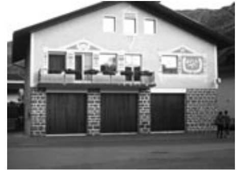
Alte Stelle, 1982, Bahnhofstraße

Heute darf sich die Sektionsstelle des Weißen Kreuzes von Naturns als eine, den neuzeitlichen Erfordernissen entsprechende, Rettungseinrichtung erfreuen. Dieser gewaltige Fortschritt beruht auf der unermüdlichen Mit- und