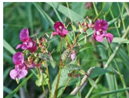
Das Drüsige Springkraut sieht mit seinen purpurroten bis weiß-rosa Blüten sehr schön aus und wurde als Gartenpflanze von den Engländern aus Indien mitgebracht.

Eine der Pflanzen, die sich massiv ausbreitet und den anderen heimischen Arten den Platz raubt, ist das Drüsige Springkraut ( Impatiens glandulifera ). In kurzer Zeit kann es eine Höhe von zwei Metern erreichen und so andere Pflanzen überdecken. Dafür braucht es feuchte, nasse Böden. Die Ufer von Flussläufen findet es ideal für seine Verbreitung. Die in den Kapseln enthaltenen Samen werden durch kleinste Erschütterungen bis zu sieben Meter weit in die Umgebung geschleudert. Die Bekämpfung erfolgt dort, wo es andere heimische Arten zu sehr verdrängt. Die Pflanze wurzelt sehr flach und kann leicht ausgerissen werden. Großflächige Ausbreitungen können