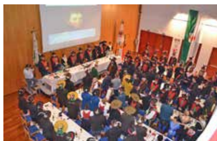
Festversammlung von oben beim Absingen der Landeshymne.