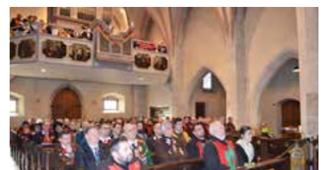
Hl. Messe beim Bezirkstag.