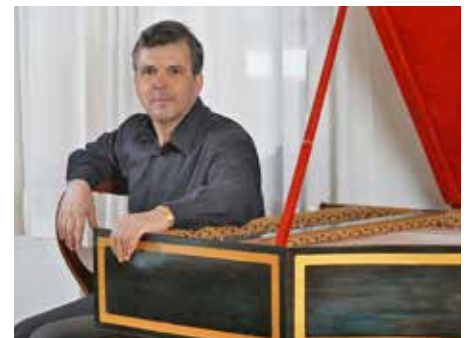
Peter Waldner Polygonales Spinett.

Der Abend bietet eine Mischung aus Konzert und kunstgeschichtlicher Führung und gibt den Besuchern die einma-