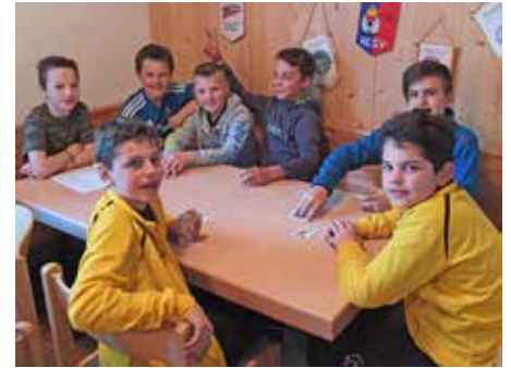
Jugend Bezirksmeisterschaft in Goldrain.