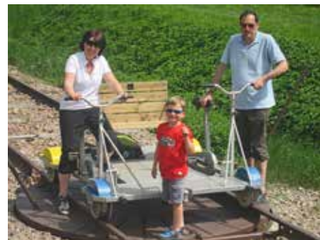
Eine Familie mit der Fußdraisine.