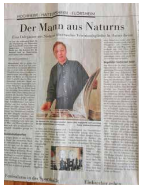
Zeitungsartikel über eine beginnende „Schach-Freundschaft“.

bringen. Nischler erzählte dabei den interessierten Hettenheimern einige Abschnitte aus der Südtiroler Geschichte und berichtete über die Entwicklung von Naturns und die kulturellen und gesellschaftlichen Gepflogenheiten Südti-