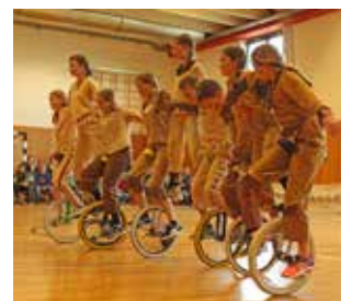
Große Gruppenkür der Indianer.