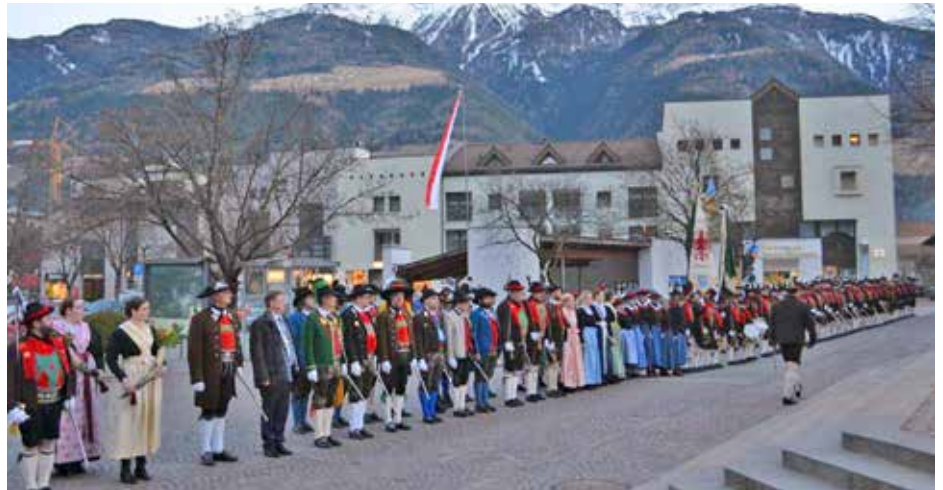
Rund 120 Teilnehmer in Tracht beim Bezirkstag in Naturns.

Mit dem Absingen der Landeshymne endete der gelungene und feierliche Bezirkstag, welcher von der Schützenkompanie Naturns ausgerichtet wurde und die sich bei der Bevölkerung recht herzlich für die Teilnahme und Mithilfe bei der festlichen Beflaggung des Dorfes am Bezirkstag bedankt, sowie bei der Pfarrei, der Gemeindeverwaltung und allen, die einen Beitrag zum Bezirkstag geleistet haben. (Dietmar Rainer)