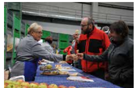
Die Besucher der Landwirtschaftsschau „Zwischen Berg und Tal“ verkosteten bäuerliche Produkte und informierten sich über die Landwirtschaft.