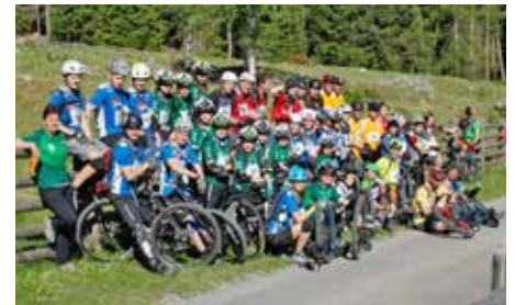
Die gesamte Einradgruppe.