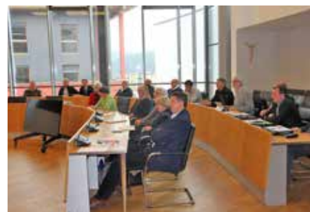
Die weiteren Teilnehmer.