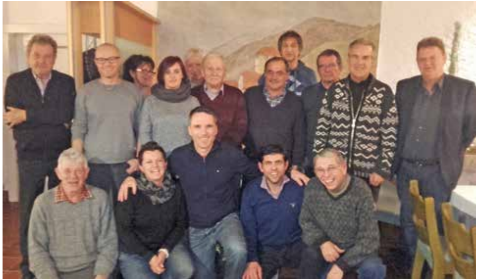
Freiwilligengruppe Essen auf Rädern.

Im Durchschnitt fahren die Freiwilligen zwischen 7-10 Essen täglich zu den alten, pflegebedürftigen Menschen. Dazu benötigen sie ca. 1 Stunde. „Einmal mehr, einmal weniger, denn alle wollen, dass wir uns kurz Zeit nehmen mit ihnen ein bisschen zu reden“, erklärt ein freiwilliger Mitarbeiter. Die Erfahrungen nach vielen Jahren der Essenzustellung beschrieben die Freiwilligen durchwegs als sehr positiv. „Die alten Leute freuen sich, wenn wir kommen. Soviel Abwechslung - jeden Tag ein neues Gesicht - hatten viele der alten Menschen noch nie!“ erzählten sie. Das motiviere auch, weiterzumachen. Außerdem haben sich alle Mitglieder der Gruppe gut aufeinander eingespielt und pflegen einen guten Zusammenhalt.