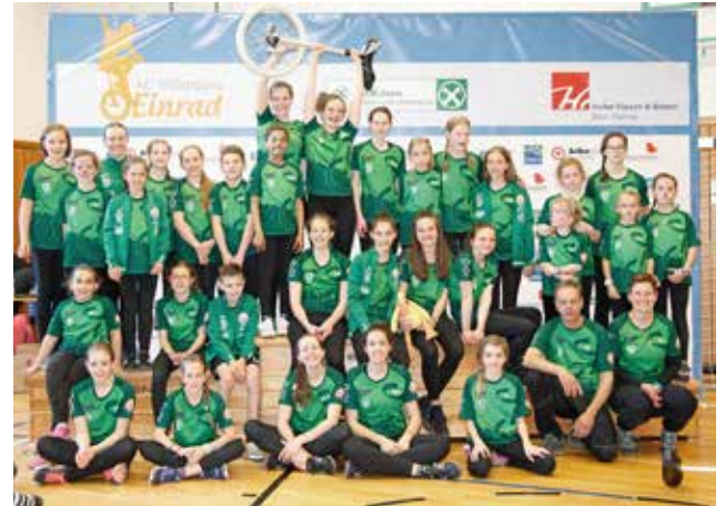
Gruppenbild der Naturnser Teilnehmer an der Freestyle Landesmeisterschaft Villanders 2017.

Auch der Nachwuchs, der zum ersten Mal an der Landesmeisterschaft teilnahm, konnte sich über Medaillen freuen. In der Kategorie „große Gruppe“ (ab 8 Fahrer) konnten sie sich mit viel Fleiß und Spaß an der Sache den 3. und 4. Platz holen. Platz 2 ging an den AC Villanders und Landesmeister wurde wie im Jahr zuvor der SSV Naturns mit der Kür „Die Schöne und das Biest“.