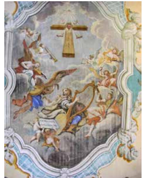
Deckenfresko Tschirland.