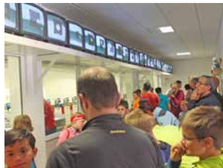
VSS Landesmeisterschaft in Kaltern.