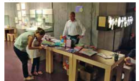
Internationaler Museumstag.