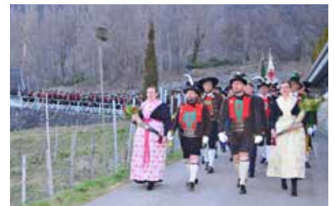
Bezirksformation beim Abmarsch zur Festversammlung.