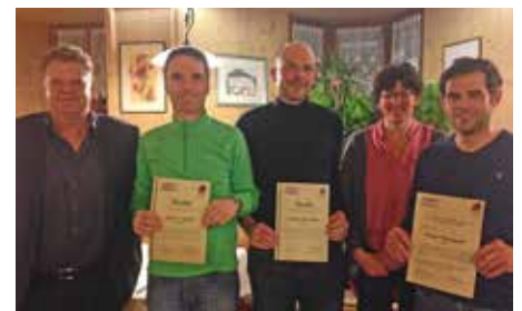
Die Geehrten der Freiwilligengruppe.